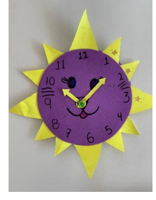
Alumnos de 3ro de preescolar realizando actividad de "Los números y el reloj"