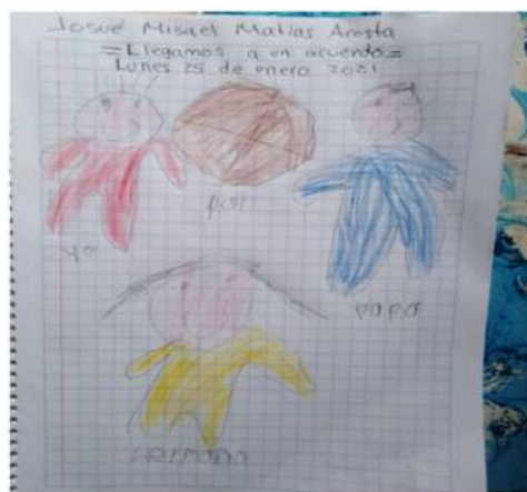
Algunas producciones realizadas por los alumnos en los que explicaron, de qué manera resolvió un conflicto.